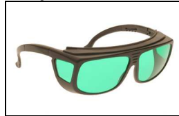
Tipo de montura